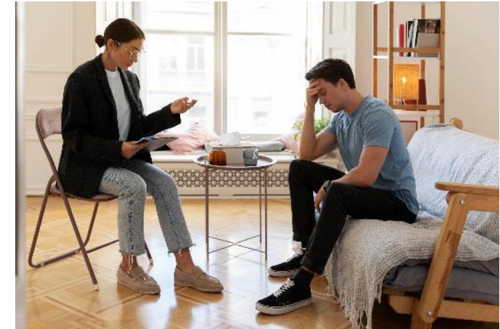
Traitement intensif bref à domicile (TIBD)