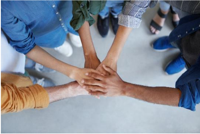
Équipe d'Accompagnement Bref dans la Communauté (ABC)