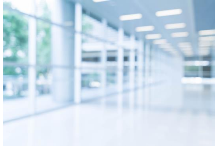
Unité d'intervention brève en psychiatrie (UIBP)