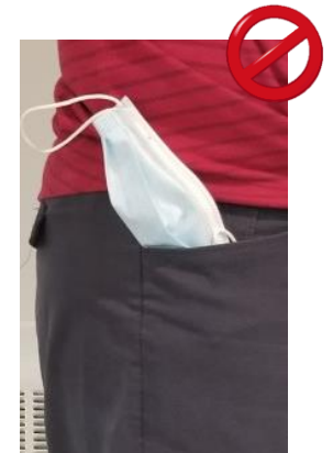
Dans une poche