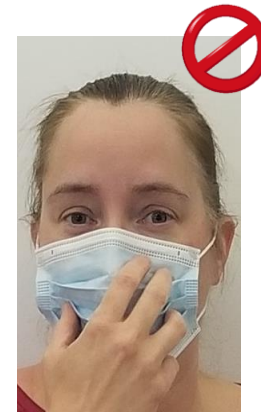
Toucher le masque