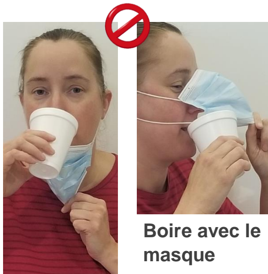
Boire avec le masque