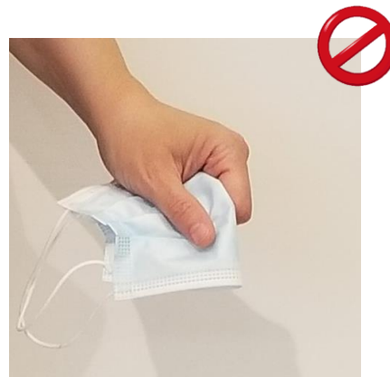
Dans la main/chiffonné