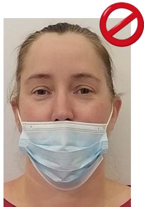
Sous le nez