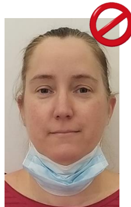
Dans le cou